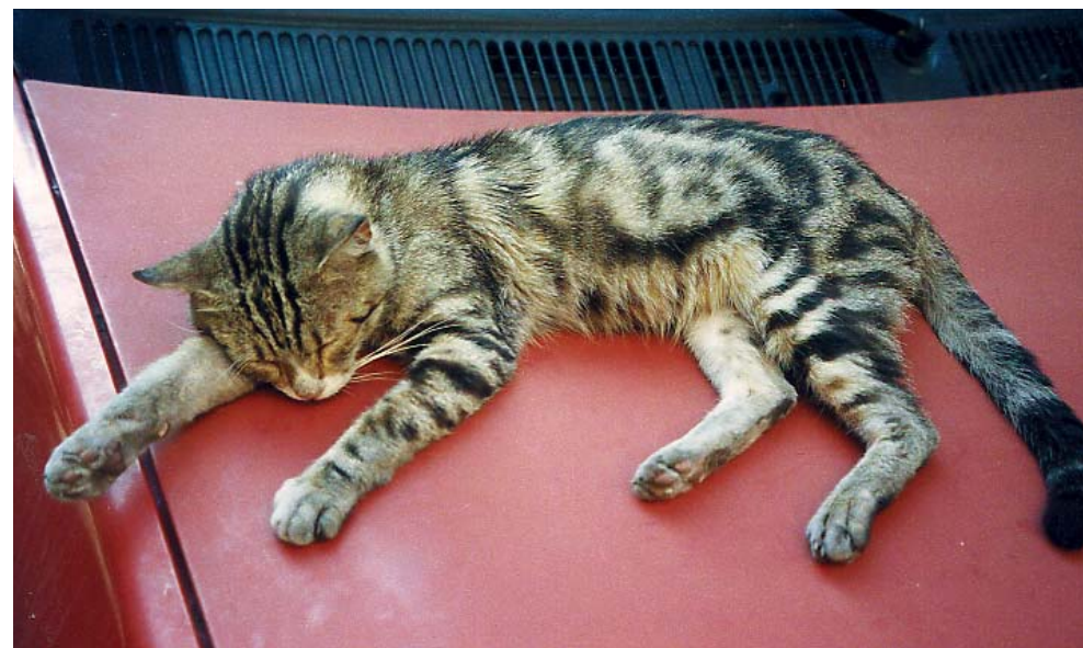
Hier läßt es sich ruhig schlafen! Menschen und Tiere leben in friedlicher Koexistenz - die vielen Spuren staubiger Katzenpfötchen jedenfalls stören keinen römischen Autofahrer.